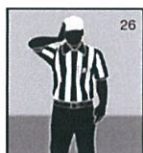
ハンド トウ フェイス